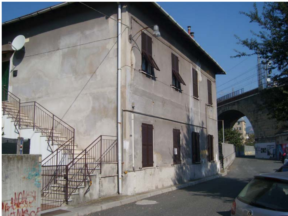
Vista da SE