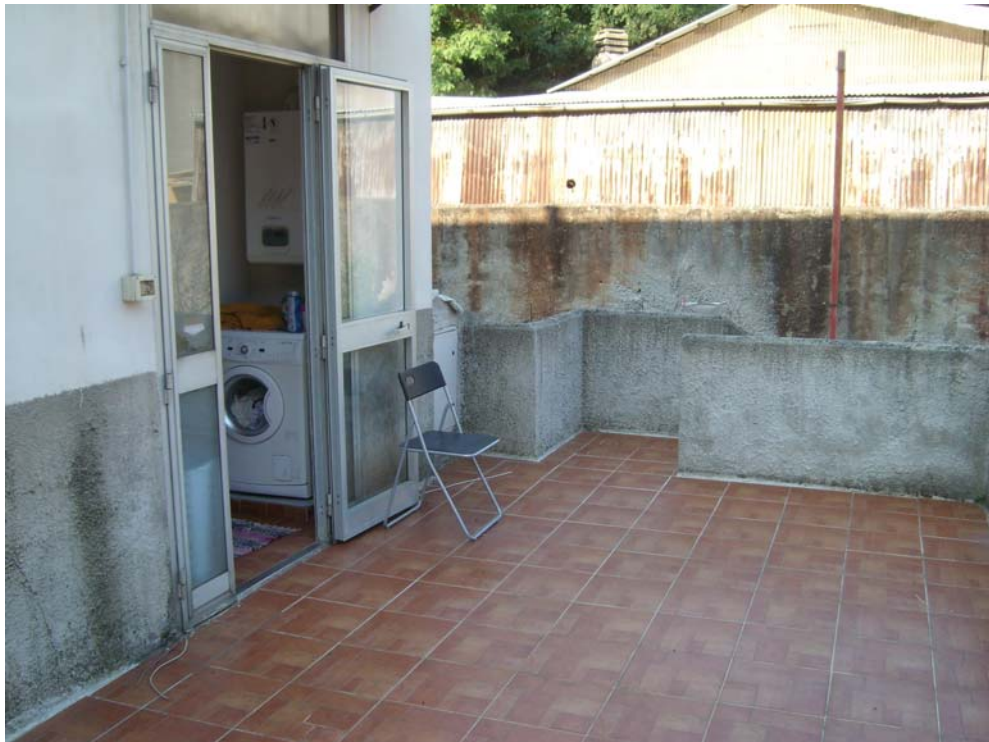
Ingresso e corte comune