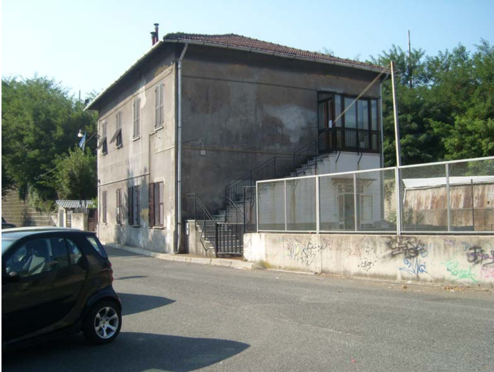
Vista da NE