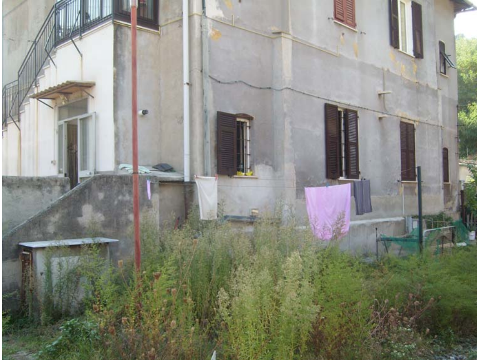
Vista da NO