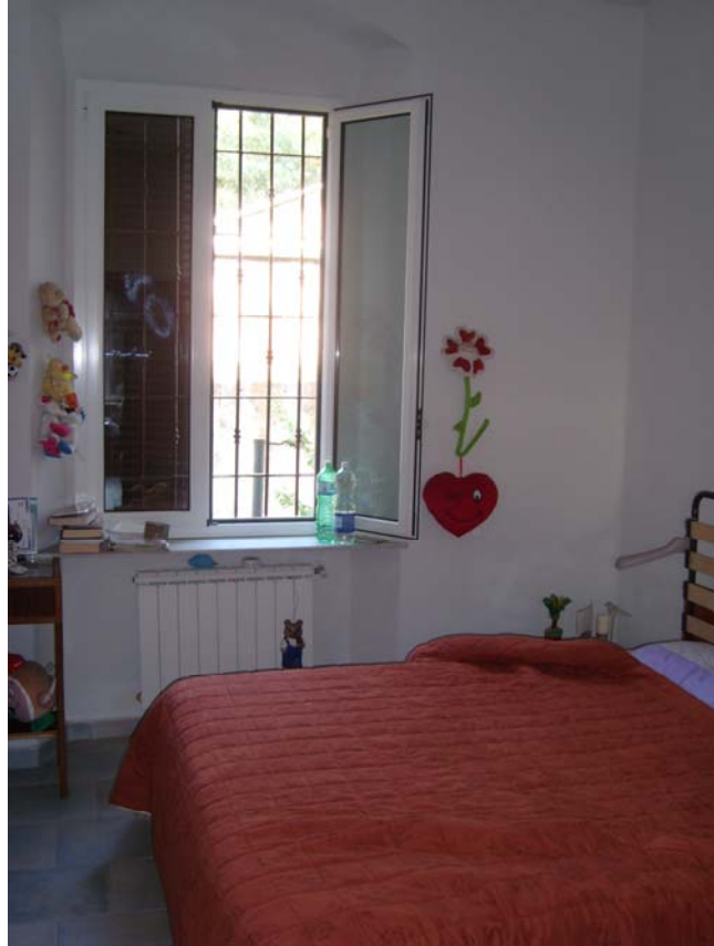
Camera lato O