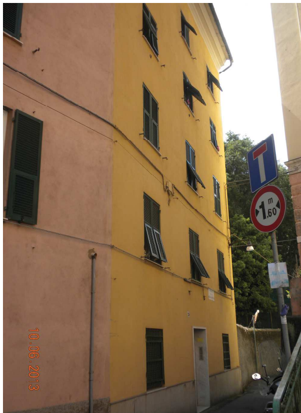
Fotografia n. 2 – androne condominiale.