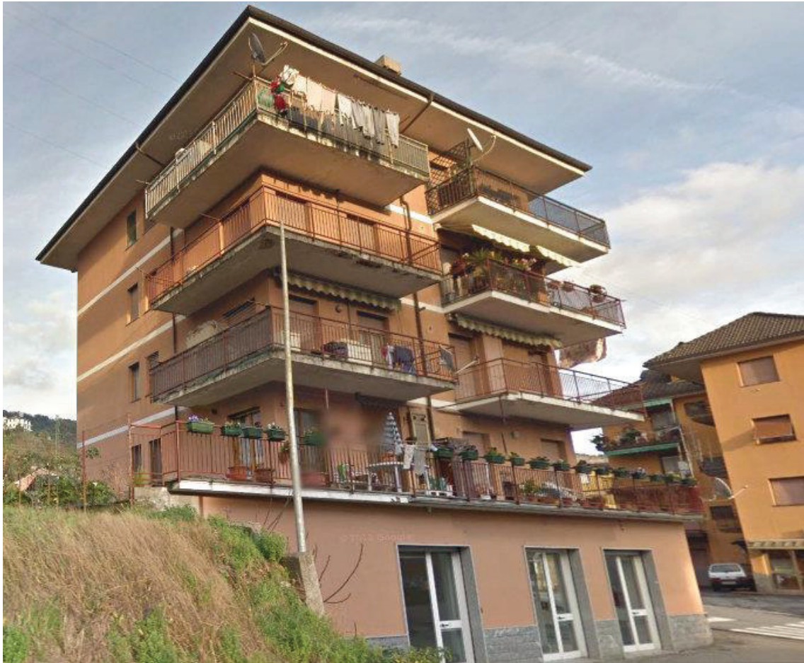
FOTO 1: fabbricato di cui l'immobile in oggetto fa parte (prospetti sud e ovest)