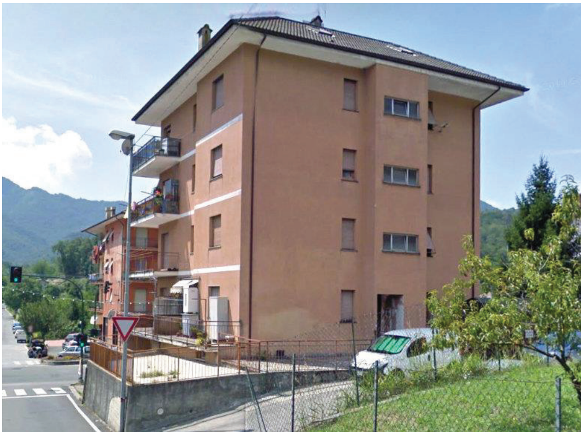
FOTO 2: fabbricato di cui l'immobile in oggetto fa parte (prospetti nord e est)